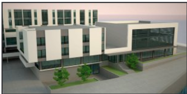
Budući izgled Hotela

Početak radova je planiran za 3. maj 2013. godine, a obaveza investitora je da u roku godinu dana, tj. do maja 2014. godine završi grube radove – krov i zatvaranje vanjskih otvora.